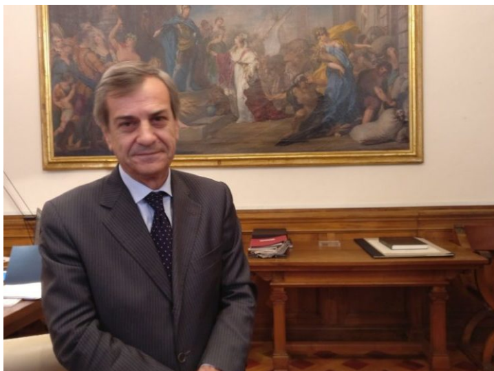
Il prefetto Armando Gradone

Verrà riservata ancora più attenzione nella valutazione preventiva dei rischi